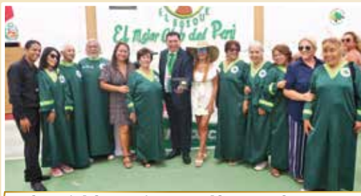
El Comité de Coro interpretó las sagradas notas del Himno Nacional del Perú y el Himno del Country Club El Bosque.