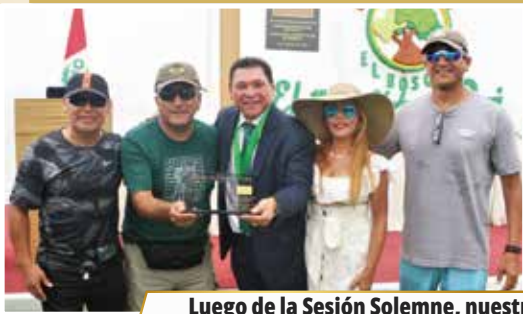
Luego de la Sesión Solemne, nuestros asociados disfrutaron del compartir general en unión de la toda la familia bosquense.